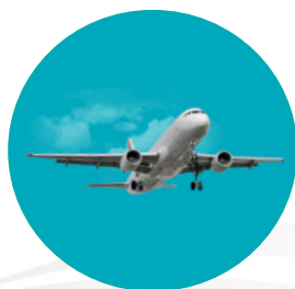
Aviation & Tourisme

Horizons Academy propose une large gamme de solutions dédiées aux professionnels et à la formation de vos personnels .